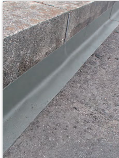
縁石立ちあがり部